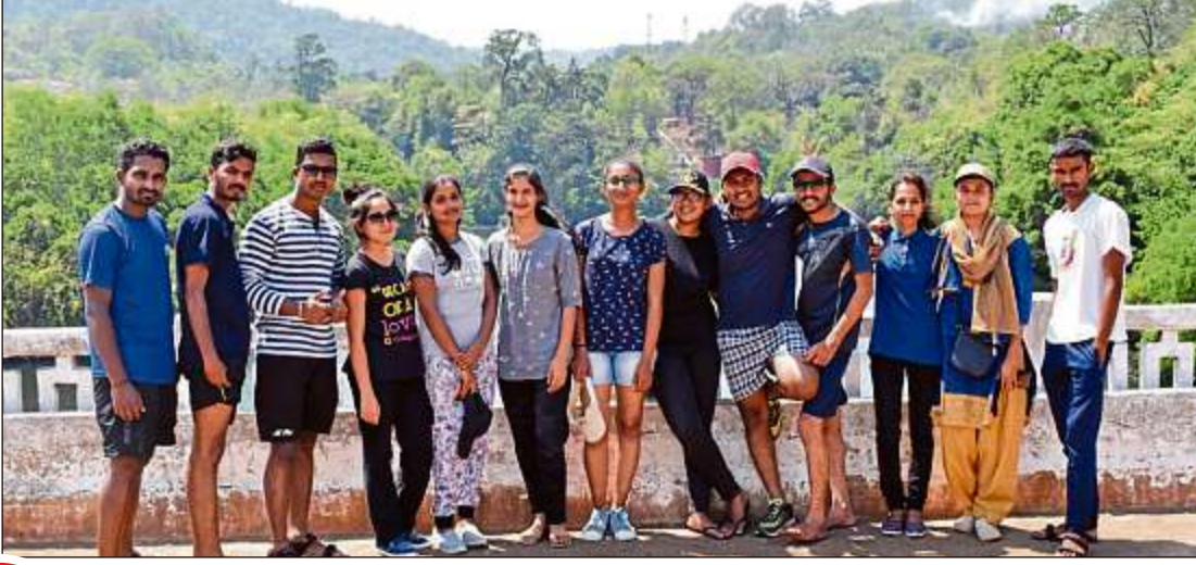
ದಾಂಡೇಲಿ ಪ್ರವಾಸದಲ್ಲಿ ಸ್ನೇಹಿತರೊಂದಿಗೆ ಕಳೆದ ಕ್ಷಣ

ಅವರ ಮಾತುಗಳನ್ನು ಅರ್ಥ ವಾಕ್ಯಗಳಂತೆ ಅಂಗವಾಗಿ ನಾಟಕ ಕೆಲಸಕ್ಕೆ ತೆಳೆದವು. ಹೀಗೆ ಕಾಲೇಜಿನ ಕೊನೆಯ ದಿನಗಳು ಹತ್ತಿರವಾಗಿದ್ದೇ ತಿಳಿಯಲಿಲ್ಲ, ನಮ್ಮ