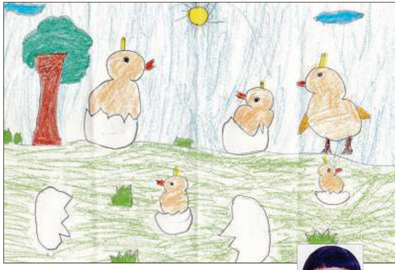
ಪ್ರಮತಿ ಹಿಲ್‌ವ್ಯೂ ಅಕಾಡೆಮಿಯ 2ನೇ ತರಗತಿ ವಿದ್ಯಾರ್ಥಿನಿ ಎನ್.ಎ.ಅನ್ನಿತಾ ದಿಡಿಸಿದ ಚಿತ್ರ