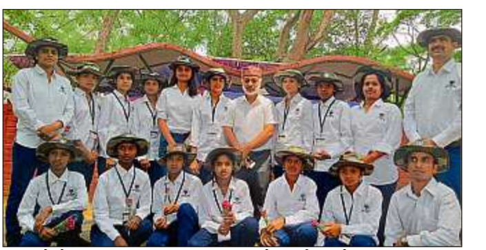
ಚಾರಣಕ್ಕೆ ಹೊರಡುವ ಮುನ್ನ ರಂಗಾಯಣದ ಚಿಣ್ಣರ ಮೇಳದಲ್ಲಿ ಶುಭಕೋರಿದ ಸಂದರ್ಭ