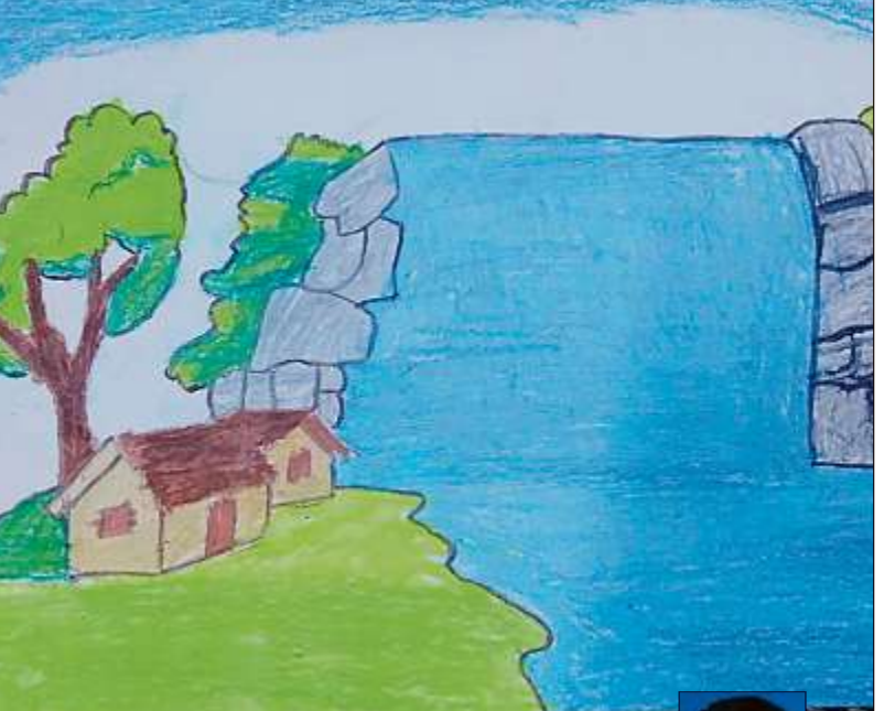
ಸಿದ್ಧಾರ್ಥನಗರದಲ್ಲಿರುವ ಜಿಎಸ್‌ಎಸ್ ಪಬ್ಲಿಕ್ ಶಾಲೆಯ 4ನೇ ತರಗತಿಯ ವಿದ್ಯಾರ್ಥಿ ಎಚ್.ಎಸ್.ಇಶಾಂತ್ ಬಿಡಿಸಿದ ನಿಸರ್ಗ ಚಿತ್ರ