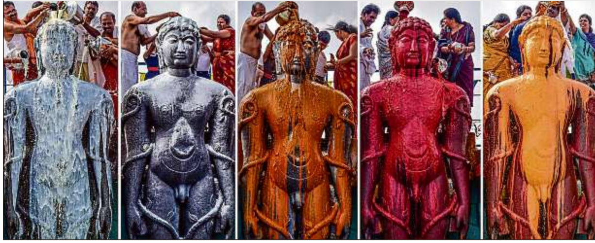
ಮಸ್ತಕಾಭಿಷೇಕದಲ್ಲಿ ಮಿಂದ ಬಾಹುಬಲಿ